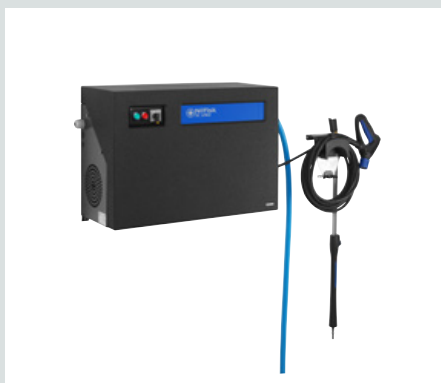
Toebehoren opbergkit voor lansen, slang, pistool en schuimsproeier