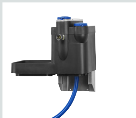
Externe vlotterbak met terugslagklep tot 40 ltr/min.