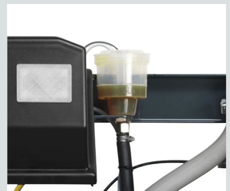
Pomprioreservoir met niveau indicatie (zicht) en vul-/leegfunctie