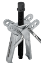
Trekker, gegalvaniseerd, twee kruiselingse armen, 70-85 mm 4614-1