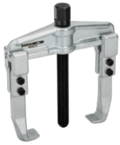
Trekker, universeel, gegalvaniseerd, twee armen, 25 - 130 mm, 100 mm 4532-B