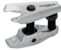
Kogelgewrichttrekker, universeel, gegalvaniseerd, 24 mm 4545-N2