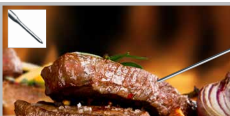
Lange, uitklapbare insteeksensor met zeer dunne meetpunt