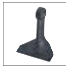
Mazza leggera Light hammer arteau léger Leichter Hammer Lichte hamer