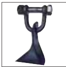
Coltelli a spatola Paddle knives Couteaux à cuillère Spachtelmessern Lepelmessen