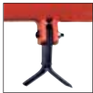
Coltelli ad "Y" "Y" shaped knives Couteaux "Y" "Y" Messer "Y"-messen