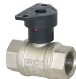
RVS kogel, ventiel van vernikkeld messing

JORC is NEN - EN - ISO 9001:2015 gecertificeerd