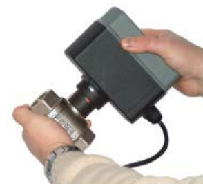
In een geval van stroomstoring is handmatig openen of sluiten mogelijk