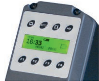
Quartzgestuurde timer met LCD-display