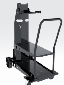
winkelwagen ref. 041257